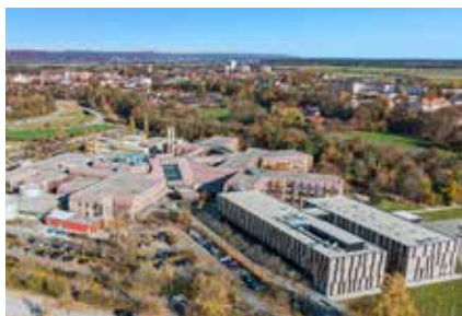
Luftaufnahme des InnKlinikums Altötting

An den Standorten in Altötting und Burghausen sorgt die MTG mit Sicherheits- und Kommunikationstechnik für einen reibungslosen Betrieb. So ist jetzt in Altötting und Burghausen ein hochverfügbares Unify-Kommunikationssystem im Einsatz. Es ist voll in die IT-Landschaft integriert und die Systeme sind untereinander vernetzt. Über beide Standorte verteilt eingesetzte Contact-Center-Technologie sorgt für eine noch effizientere Kommunikation. Am Standort Altötting wurden zudem zahlreiche Mitarbeitende mit modernster DECT-Technologie für mobiles Arbeiten in der