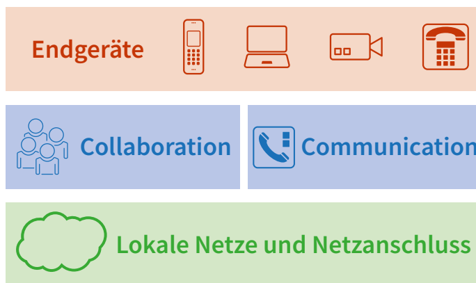
Abgestimmte Elemente einer Gesamtlösung

Mit Teams steht den Mitarbeitern ein komplexes Collaboration-Tool zur Verfügung. Auf Basis von Rollen- und Rechtezuweisungen unterstützt es text- und dokumentenorientiert die räumlich verteilte Arbeitsorganisation in Projektgruppen. Hinzu kommen Apps und Funktionen wie Kalendereinbindung, Präsenzstatus und Videomeetings. Die Verbindung mit dem modernen TK-System